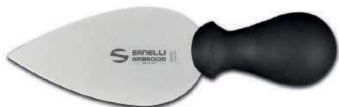
SUPRA COLTELLO GRANA A CUORE 12 CM 07595