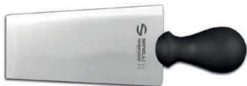
SUPRA COLTELLO VENETO 15 CM 07596