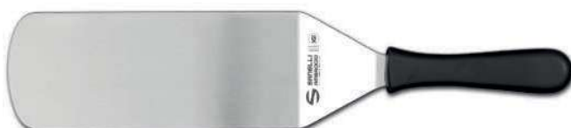
SUPRA SPATOLA HAMBURGER 25 CM 07601