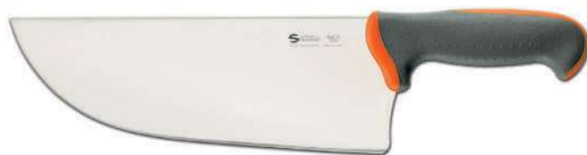
TECNA COLTELLO MEZZO COLPO 28 CM 07575