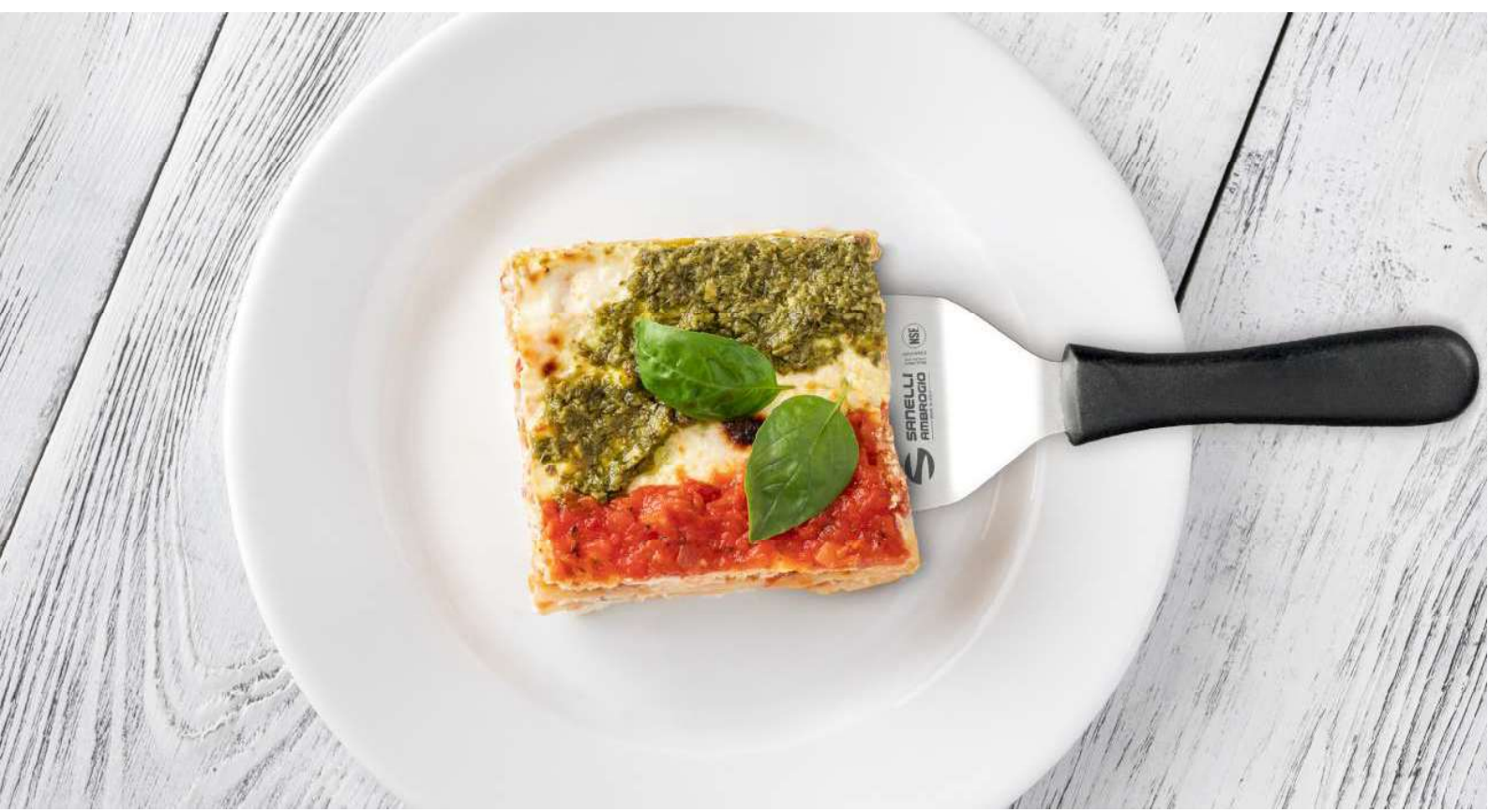
SUORA SPATOLA CUOCO A SCALINO 30 CM 07604