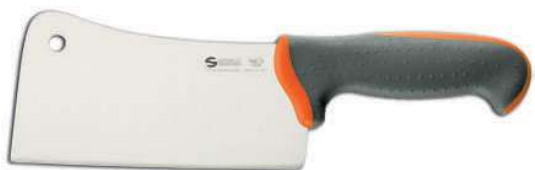
TECNA FALCETTA 18 CM 07566