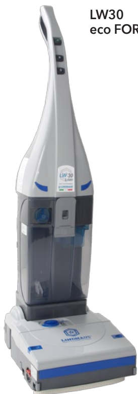
LW30 eco FORCE