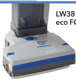
LW38 eco FORCE