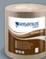
Hygenius Hands Natural 620