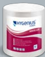
Hygenius Hands White 620