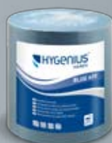
Hygenius Hands Blue 620