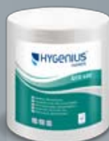
Hygenius Hands Eco 600