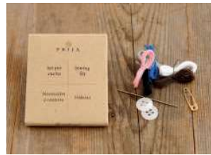
set mini cucito