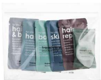
TRAVEL ESSENTIALS SET COMPLETO

La collezione Travelcare Essentials fornisce cosmetici quotidiani contenenti estratti naturali . Il profumo di fiori e bergamotto, riflette i prodotti realizzati con ingredienti naturali . Scopri la collezione completa realizzata in Italia, clinicamente testata, senza parabeni, oli minerali e fenossietanolo .