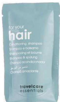
shampoo e balsamo