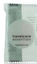
TRAVEL ESSENTIALS SAPONETTA VEGETALE 8 GR. • 600 PEZZI

Il set contiene: 1 bustina da 20 ml di shampoo doccia, 4 bustine da 15 ml di shampoo, gel doccia, crema corpo, balsamo ed 1 sapone vegetale da 8 g. Dimensioni: 160x190 mm