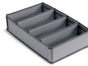
Organizzatore Magic Hotel